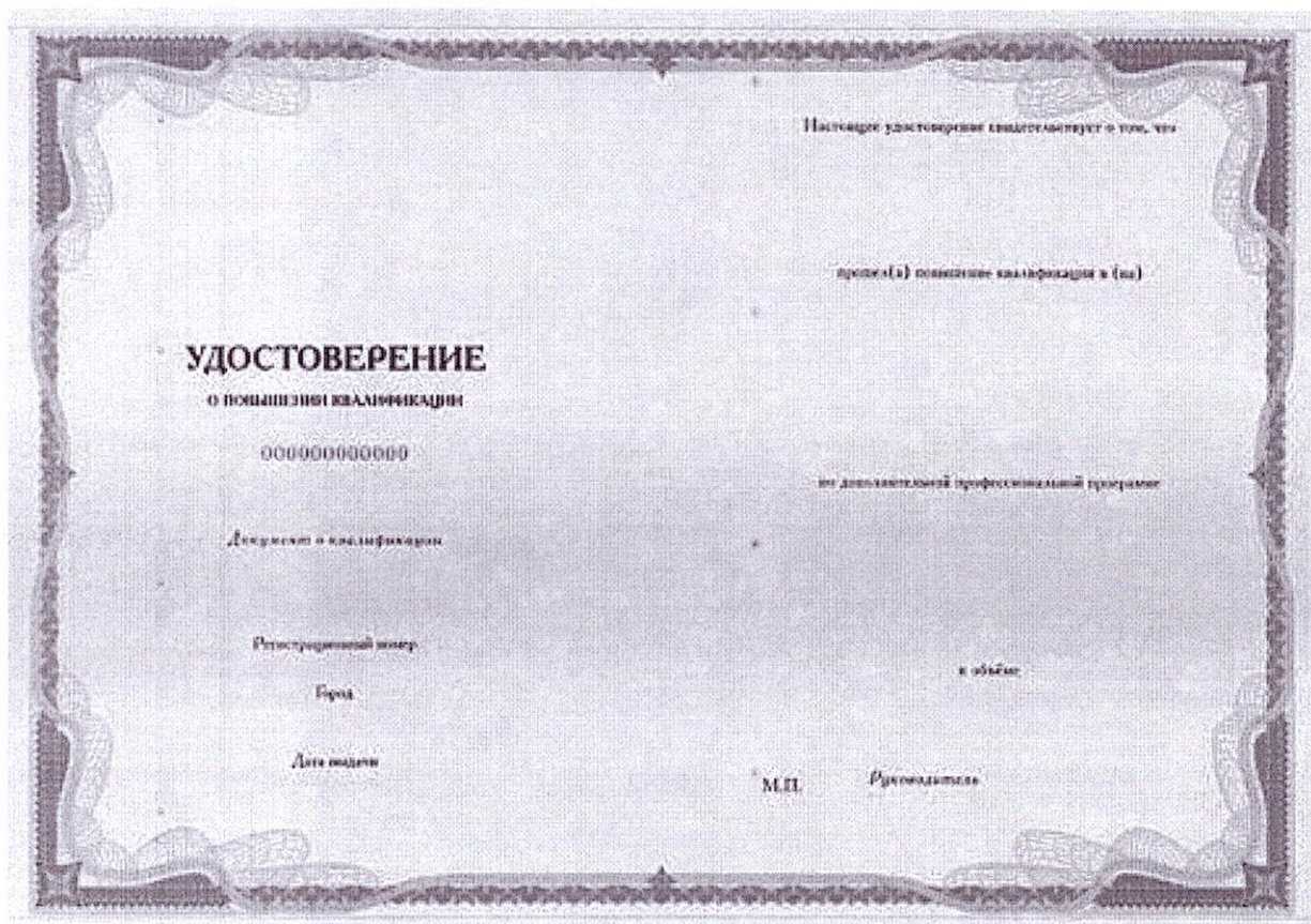
Рис. Разворот удостоверения о повышении квалификации