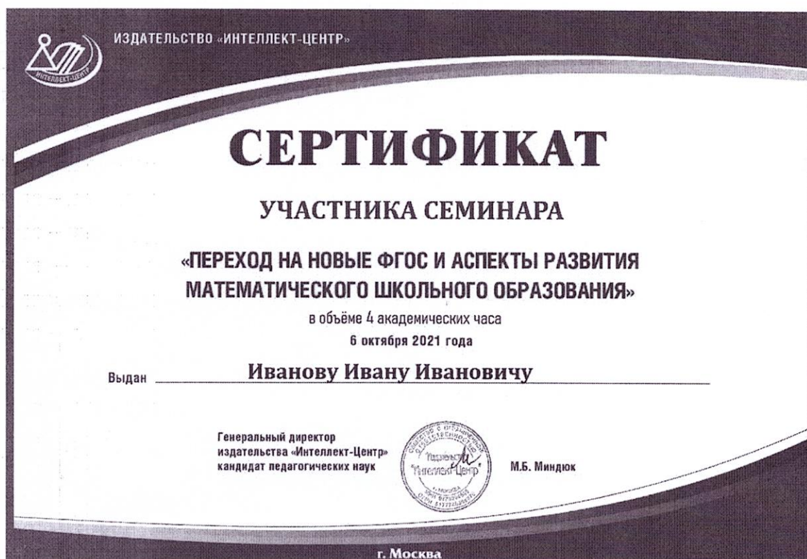
Рис. Образец сертификата